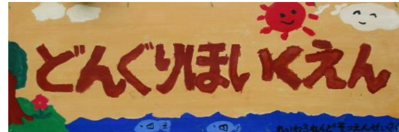
二つに分かれていた園が、ひとつになりました！